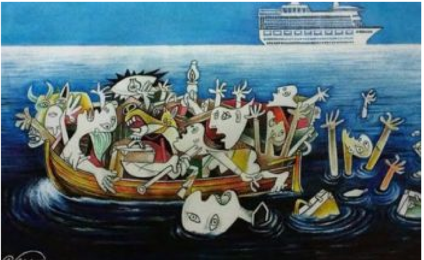
Tassazione e irrazionalità politica