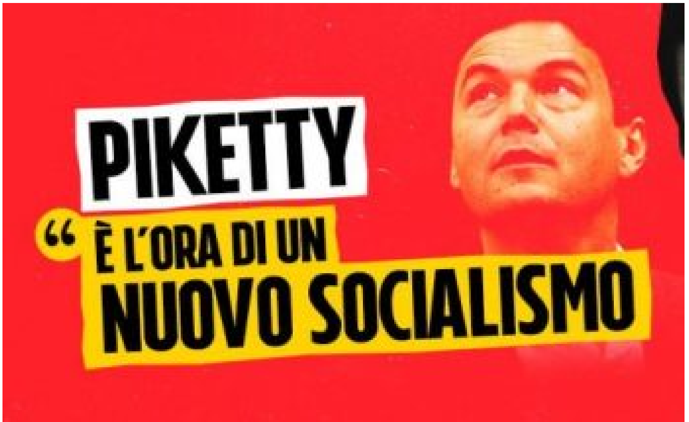
Sostiene Piketty (ovvero, cambiare si può)